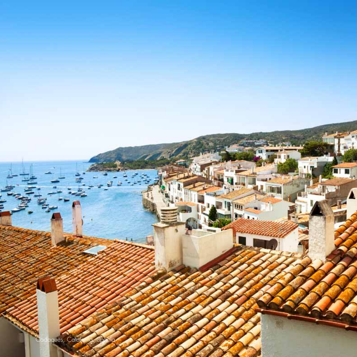
Cadaques, Catalonia, Spain