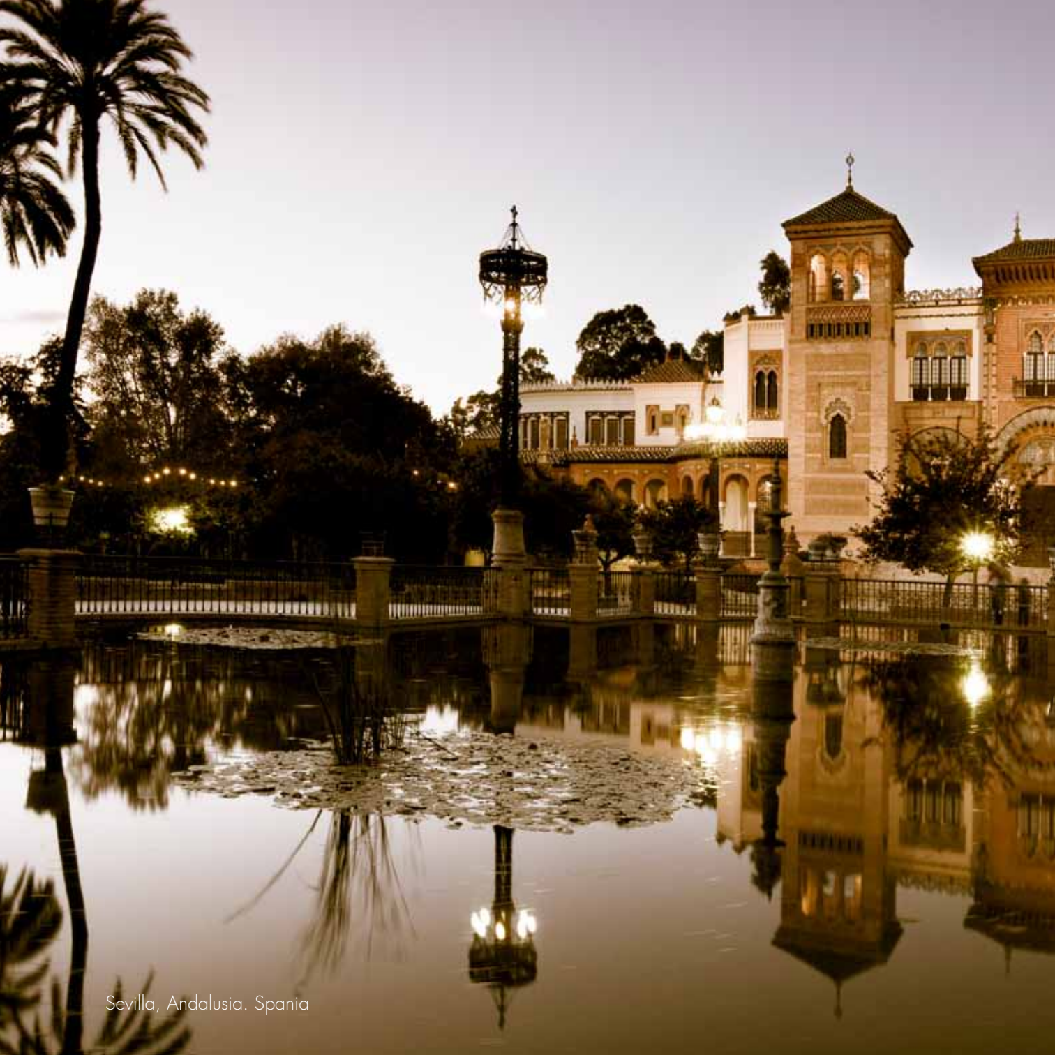
Sevilla, Andalusia. Spania