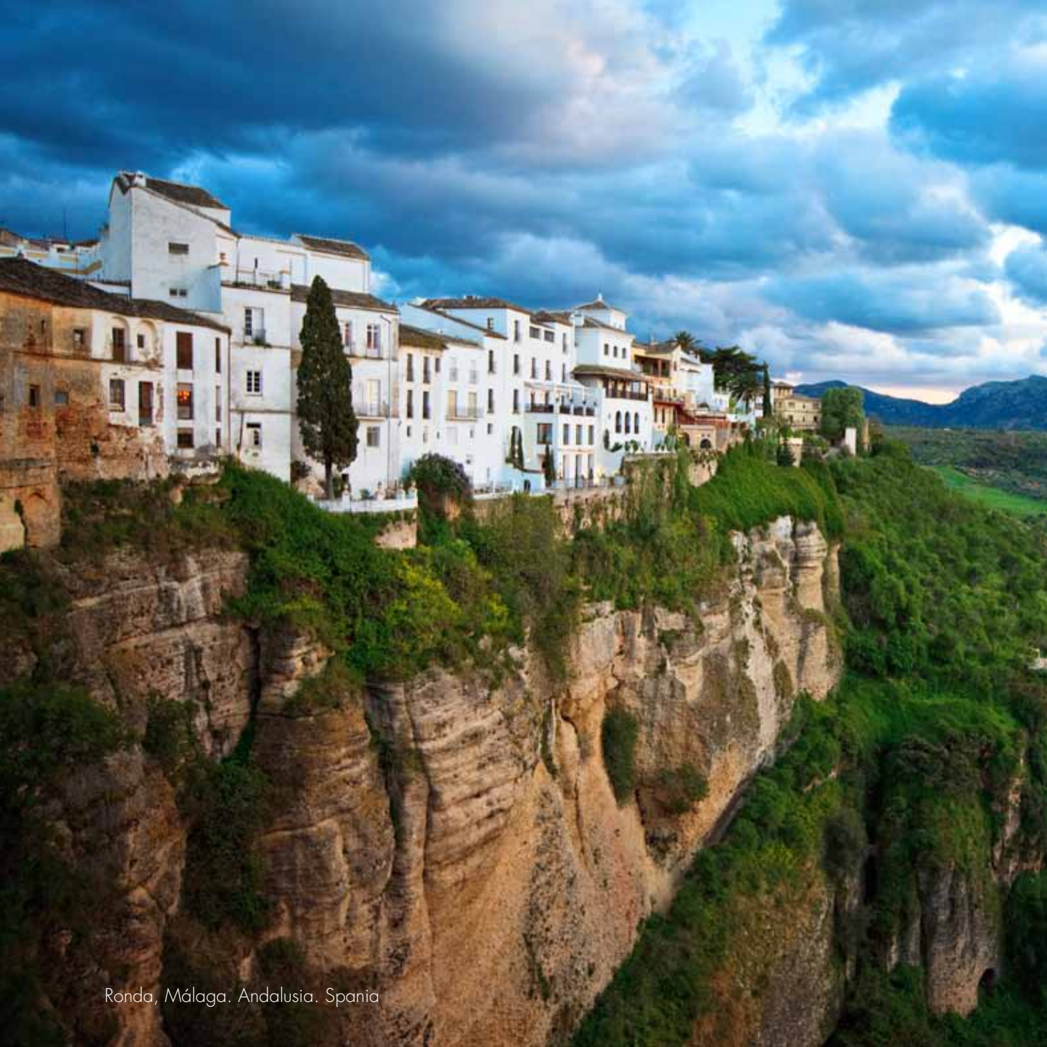
Ronda, Málaga. Andalusia. Spain