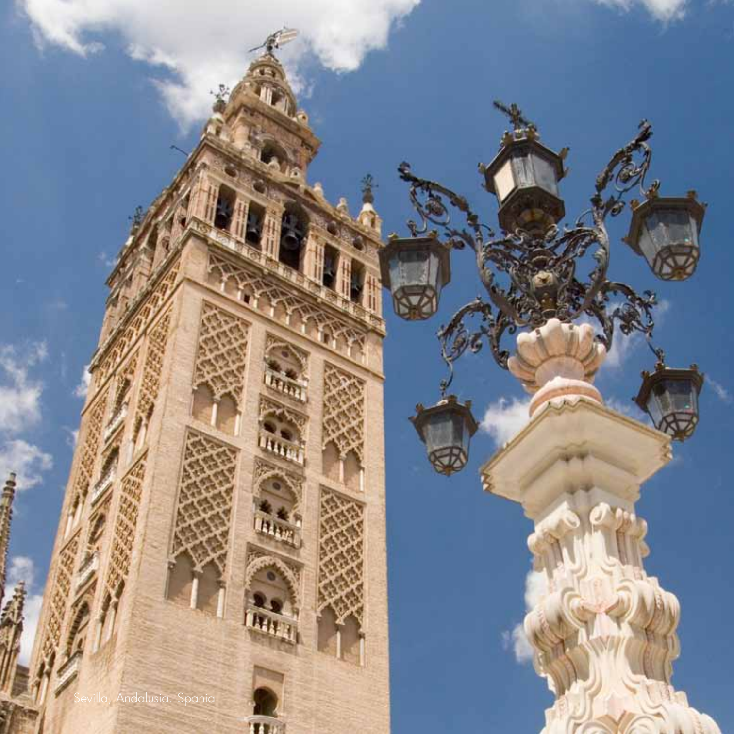
Sevilla, Andalusia: Spania