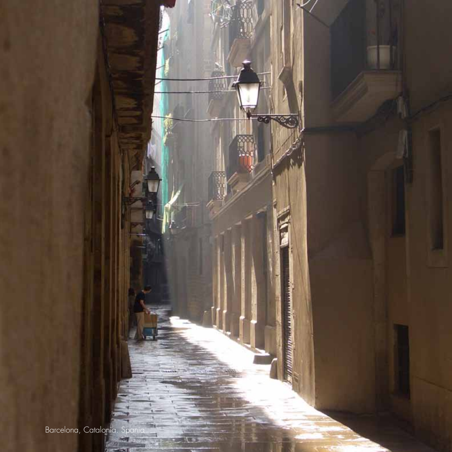
Barcelona, Catalonia. Spain