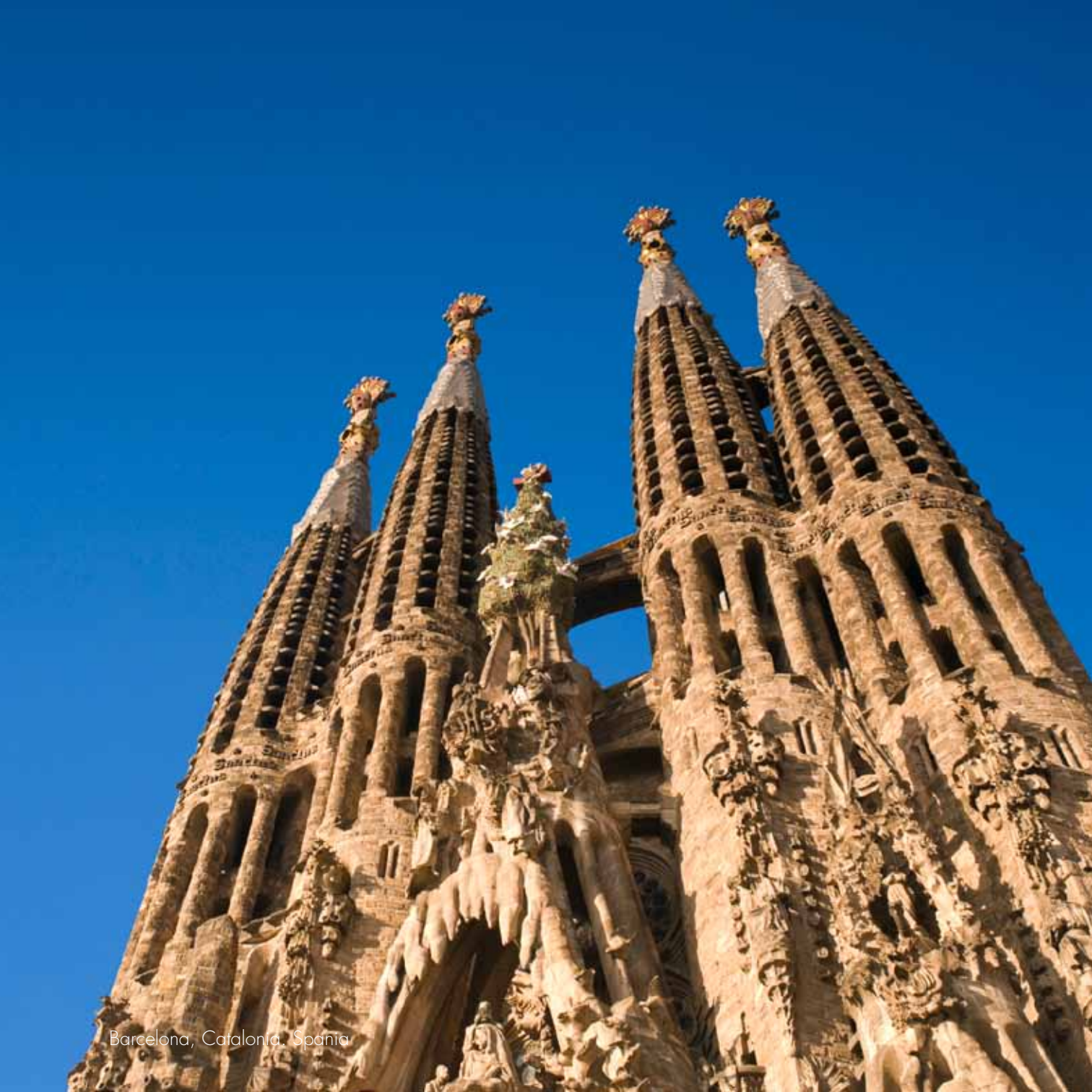
Barcelona, Catalonia, Spain